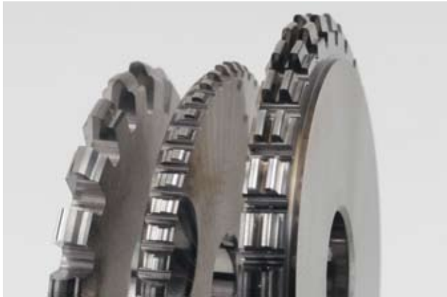
Gewindfräser mit 20 und 50 Zähnen, sowie doppelgängige Fräser mit korrigiertem Profil.

gamme d'outils standards. M. Gloor nous dit : « Notre but est de permettre à nos clients de travailler plus efficacement. Ceci se concrétise sous la forme d'outils qui leur permettent de gagner en productivité ou en qualité, mais également sous forme de prix réel par pièce réalisée (en les usinant plus rapidement ou en évitant des opérations de reprise). Un autre aspect de cette efficacité est notre capacité à leur fournir un ensemble de produits (sur mesure et standard) et de prestations pour renforcer leur performance sur leurs marchés ».