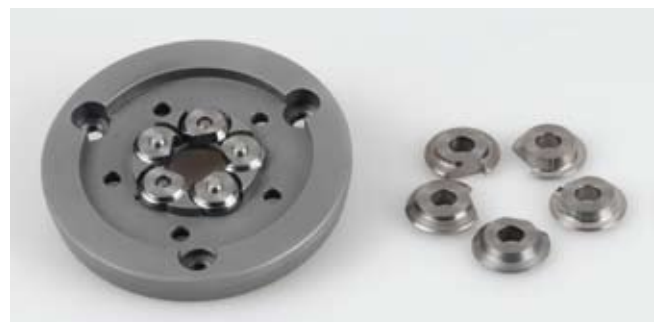
Wirbelkopfwerkzeuge mit 5 Zirkularmessern . Gloor ist der Pionier auf diesem Gebiet, den Kunden werden seit über 20 Jahren Massgeschneiderte Lösungen angeboten.

Les départements stratégiques de l'entreprise sont ceux de la technique et de la production. Car avec une volonté de "faire du spécial" comme celle qui caractérise l'entreprise, les moyens et méthodes de réalisation des outils doivent permettre non seulement une grande réactivité, mais également une flexibilité et une souplesse hors du commun. Lors de ma visite des ateliers, j'ai eu l'occasion de consulter les fiches de travail... et les séries de 15 pièces avaient plutôt tendance à faire partie des grandes séries ! M Gloor précise : « Nos moyens de production et le savoir-faire de notre personnel sont de vrais atouts. Nous avons développé nous-mêmes une bonne partie des machines sur lesquelles nous réalisons nos outils ». Nous n'en apprendrons pas plus sur les procédés originaux utilisés par Gloor SA, mais ils semblent uniques. Un système de contrôle 6 axes haut de gamme complète ce tableau.